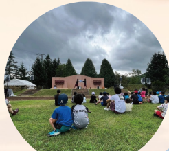
占冠村ふるさとまつり