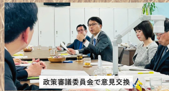
政策審議委員会意見交換