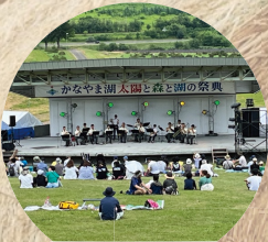
かなやま湖湖水まつり