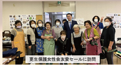
更生保護女性会友愛セールに訪問