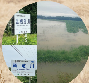
大雨被害状況確認で現地へ