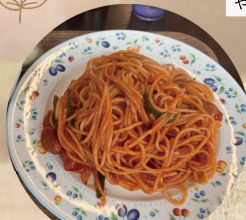
南富良野町メーブルのナポリタン!