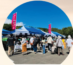
ふらのワインぶどう祭り