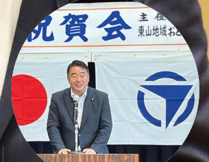
東国幹衆議と東山地域敬老会に出席