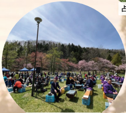
やまべさくらまつり