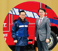
空知川総合水防演習にて船橋参議と