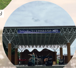
ラベンダーフェスタかみふらの