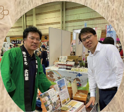
イベントにて土別ブース訪問