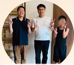
上富良野町放課後デイサービス訪問