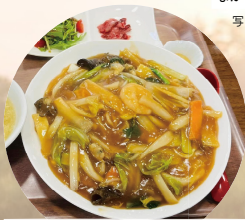
占冠村チーナのあんかけ焼きそば!