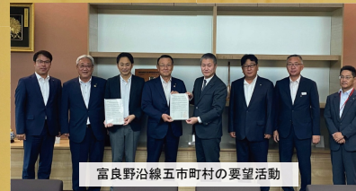
富良野沿線五市町村の要望活動